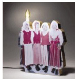
Folkdräktslampa av De